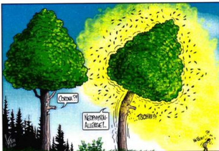
Cartoon: Silvan Wegmann

Danke, dass Sie verantwortungsbewusst handeln und Ihre Gartenabfälle fachgerecht entsorgen! Neophyten gehören in den Abfallsack! Nutzen Sie für alles andere die Grünabfuhr der Gemeinde oder erkundigen Sie sich bei der Entsorgungsstelle in Ihrer Nähe.